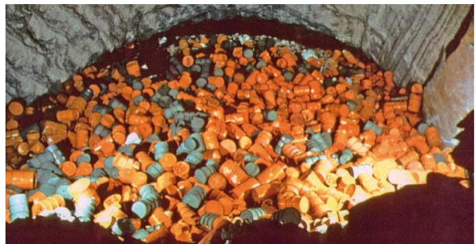
Atommüll-Einlagerung in Asse II: Abkipptechnik, vermutlich in Kammer 7 auf der 725 m-Sohle

rechtmäßig genehmigter Umgang mit Atommüll in Asse II bekannt: Der Betreiber hatte Lauge, die mit radioaktivem Caesium, Strontium und Plutonium kontaminiert war, ohne Umgangs-Genehmigung in tiefere Bereiche verbracht. Dies wurde verboten, doch nach und nach kamen immer mehr skandalöse Details ans Licht: Die eingelagerten Abfälle strahlten stärker als bekannt, ein Teil der aufgefangene Lauge hat seit Jahren Kon-